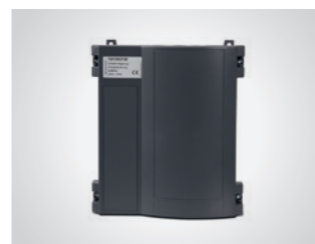
Ampelsteuerung A 800 III

Für BLACK 1200, mit 10 m Anschlusskabel, ohne Funkempfänger