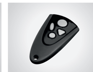
Handsender MAX 43-4

4-Kanal Handsender, 433 MHz, mit KeeLoq-Wechselcode