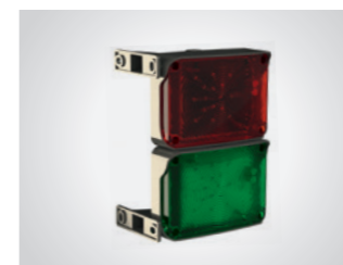
Ampel LED Rot/Grün

24 V AC/DC oder 230 V (LED) mit Halterung, Blinken o. Dauerlicht einstellbar, in Grün (1) , Rot (2) , Rot/Grün (3)