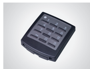
Außentaster DigiCode Premium

Metalltastatur, 433 MHz, mit KeeLoq-Wechselcode, AES