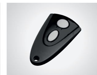
Handsender MAX 43-2

2-Kanal Handsender, 433 MHz, mit KeeLoq-Wechselcode