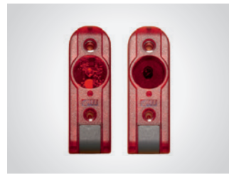
Integrierte Lichtschanke LS 2-I

2-Draht, Reichweite 8 m, für Innenbereiche