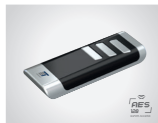
Handsender BLACK Remote

3-Kanal Handsender, 433 MHz, mit KeeLoq-Wechselcode, AES