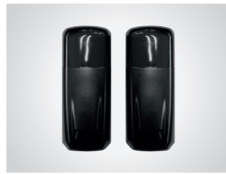
Lichtschanke LS 5F