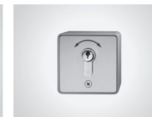
Schlüsseltaster KT 8 AP