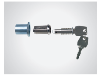
Notentriegelung mit Rundzylinder

Für doppelflügelige Tore, Deckengliedertore und Sektionaltore