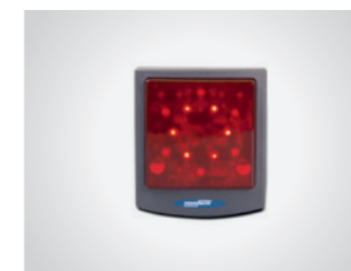
Signalleuchte LED Rot

(1) 204000-10-1-50 (2) 204000-12-1-50 (3) 204000-20-1-50